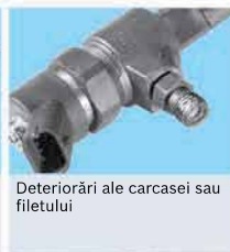
Deteriorări ale carcasei sau filetelui