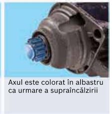
Axul este colorat în albastru ca urmare a supraîncălzirii