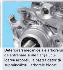
Deteriorări mecanice ale arborelui de antrenare și ale flanșei, culoarea arborelui albastru datorită supraîncălzirii, arborele blocat