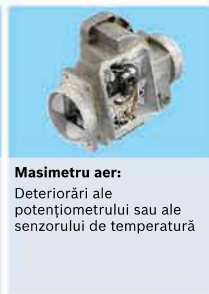
Masimetru aer: Deteriorări ale potențiometrului sau ale senzorului de temperatură