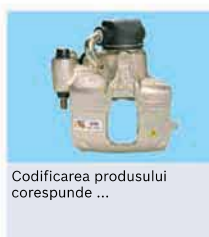
Codificarea produsului corespunde ...