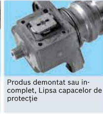
Produs demontat sau incomplet, Lipsa capacelor de protecție