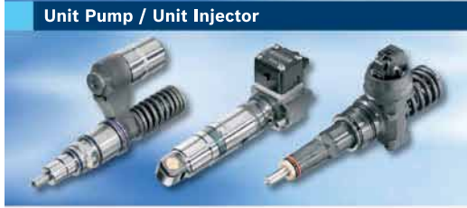
Unit Pump / Unit Injector