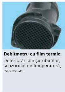
Debitmetru cu film termic: Deteriorări ale suruburilor, senzorului de temperatură, carcasei