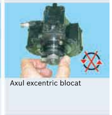
Axul excentric blocat