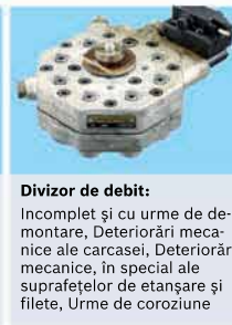
Divizor de debit: Incomplet și cu urme de demontare, Deteriorări mecanice ale carcasei, Deteriorări mecanice, în special ale suprafețelor de etanșare și filete, Urme de coroziune