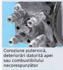
Coroziune puternică, deteriorări datorită apei sau combustibilului necorespunzător