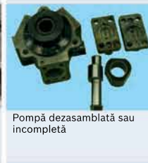
Pompă dezasamblată sau incompletă