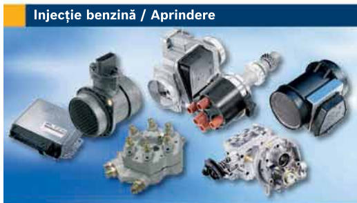
Injecție benzină / Aprindere