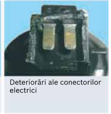
Deteriorări ale conectorilor electrici