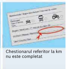
Chestionarul referitor la km nu este completat