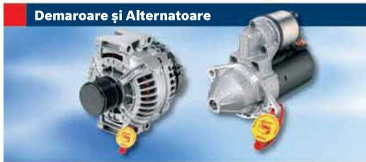
Demaratoare și Alternatoare

Motive pentru refuzarea pieselor vechi: ▶ Coroziune puternică ▶ Ansamblu demontat sau incomplet ▶ Deteriorări mecanice