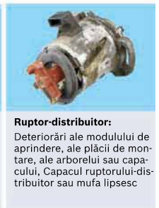
Ruptor-distribuitoare: Deteriorări ale modului de aprindere, ale plăcii de montare, ale arborelui sau capacului, Capacul ruptorului-distribuitoare sau mufa lipsesc