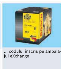
... codului înscris pe ambalajul eXchange

*pentru informații complete legate de criteriile de acceptare adresați-vă furnizorului dvs. de piese Bosch, AUTONET