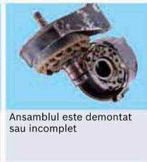
Ansamblu este demontat sau incomplet