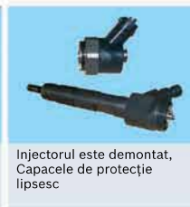
Injectorul este demontat, Capacele de protecție lipsesc